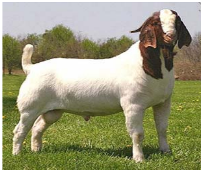
Kambing Boer sebagai pejantan unggul

Selain itu, peternak juga harus mampu menentukan umur kambing. Pendugaan umur dapat dilakukan dengan melihat kartu identitas dan dapat juga dengan melihat jumlah gigi seri tetap yang tumbuh. Bila seri tetap belum ada, maka kambing berumur kurang dari satu tahun. Apabila sudah tumbuh gigi tetap sebanyak satu pasang (dua buah), maka diperkirakan berumur 1-2 tahun. Bila terdapat dua pasang berumur 2-3 tahun, tiga pasang berumur 3-4 tahun dan empat pasang berumur antara 4-5 tahun. Apabila gigi seri tampak sudah mulai aus atau lepas, maka kambing tersebut sudah berumur lebih dari 5 tahun.