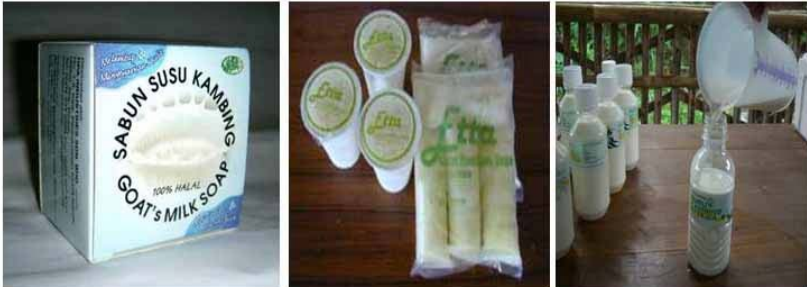
Macam produk susu kambing

Hendaknya diusahakan untuk selalu meningkatkan nilai tambah dari produksi ternak, baik daging, susu, kulit, tanduk, maupun kotorannya. Bila kambing hendak dijual sebaiknya pada saat berat badan tidak bertambah lagi (umur sekitar 1-1,5 tahun), dan permintaan akan kambing cukup tinggi. Harga diperkirakan berdasarkan: berat hidup x (45 sampai 50%) karkas x harga daging eceran.