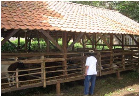
Model kandang panggung untuk ternak kambing

Kandang terbuat dari bahan yang kuat, harga murah dengan memanfaatkan bahan yang tersedia di lokasi. Kandang harus segar (ventilasi baik, cukup cahaya matahari, bersih, dan minimal berjarak 5 meter dari rumah). Sebaiknya dibuat kandang dalam bentuk panggung dengan sekat yang dapat bongkar pasang dan lantai dari bambu atau papan. Di belakang kandang dibuat penampungan kotoran dan sisa pakan. Sebagai patokan ukuran luas kandang adalah, jantan dewasa dibutuhkan 1,5 m 2 , betina dewasa 1 m 2 , betina menyusui 1 m 2 + 0,5 m 2 masing anak dan kambing muda 0,75 m 2 . Usahakan ada lampu penerang yang dipasang didalam kandang. Selain itu, didalam kandang juga disediakan tepat pakan dan minum.